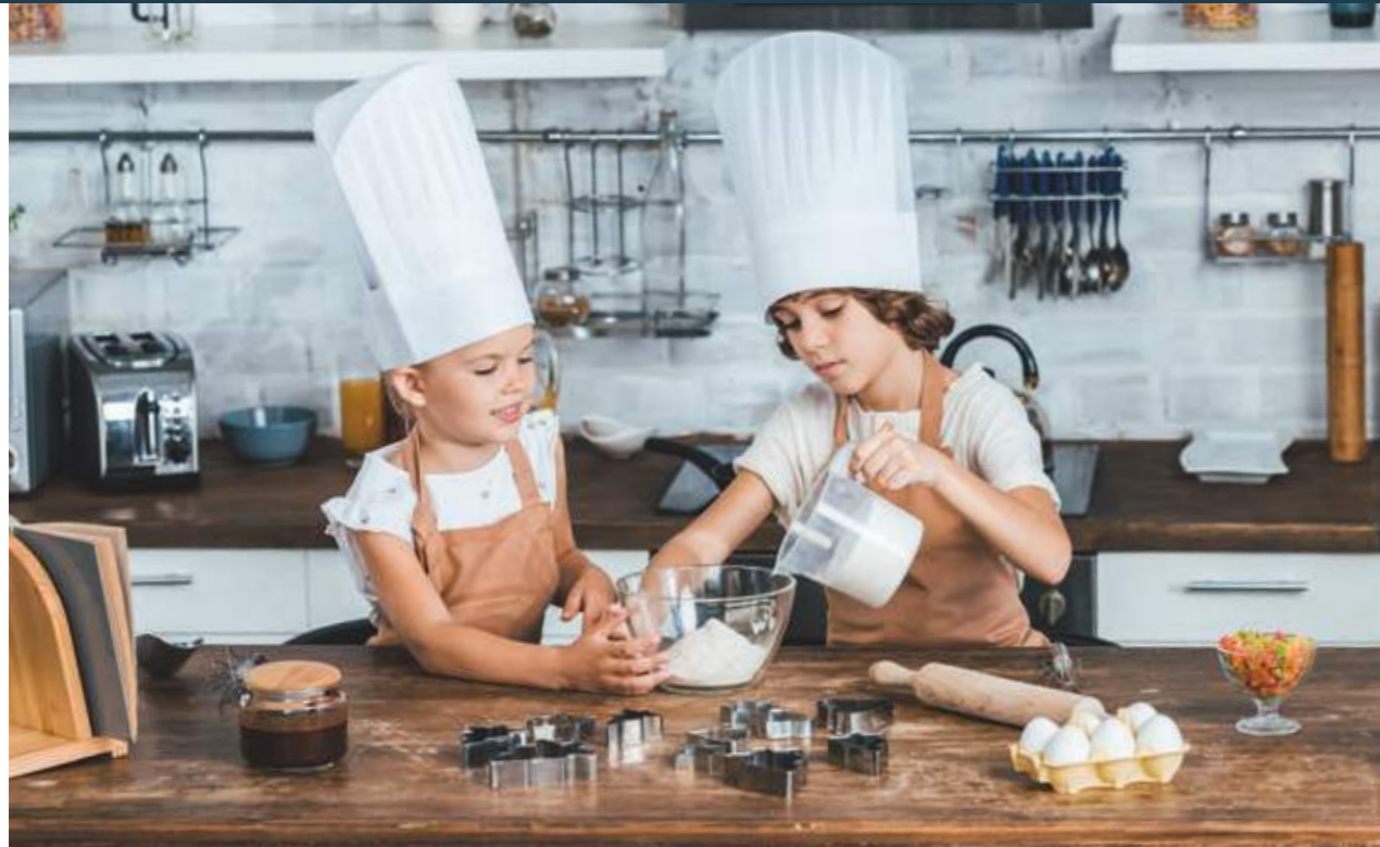
Kinder beim Backen: Bestnote für die Küchenwelt