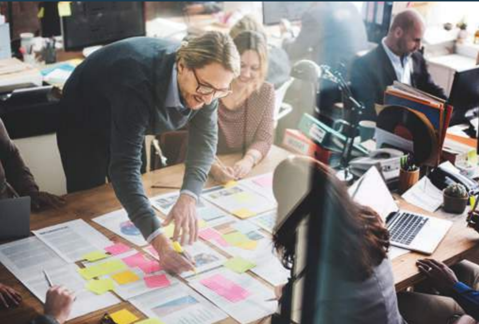
Arbeit im Team: Ein gesundes Klima ist die Basis für beruflichen Erfolg