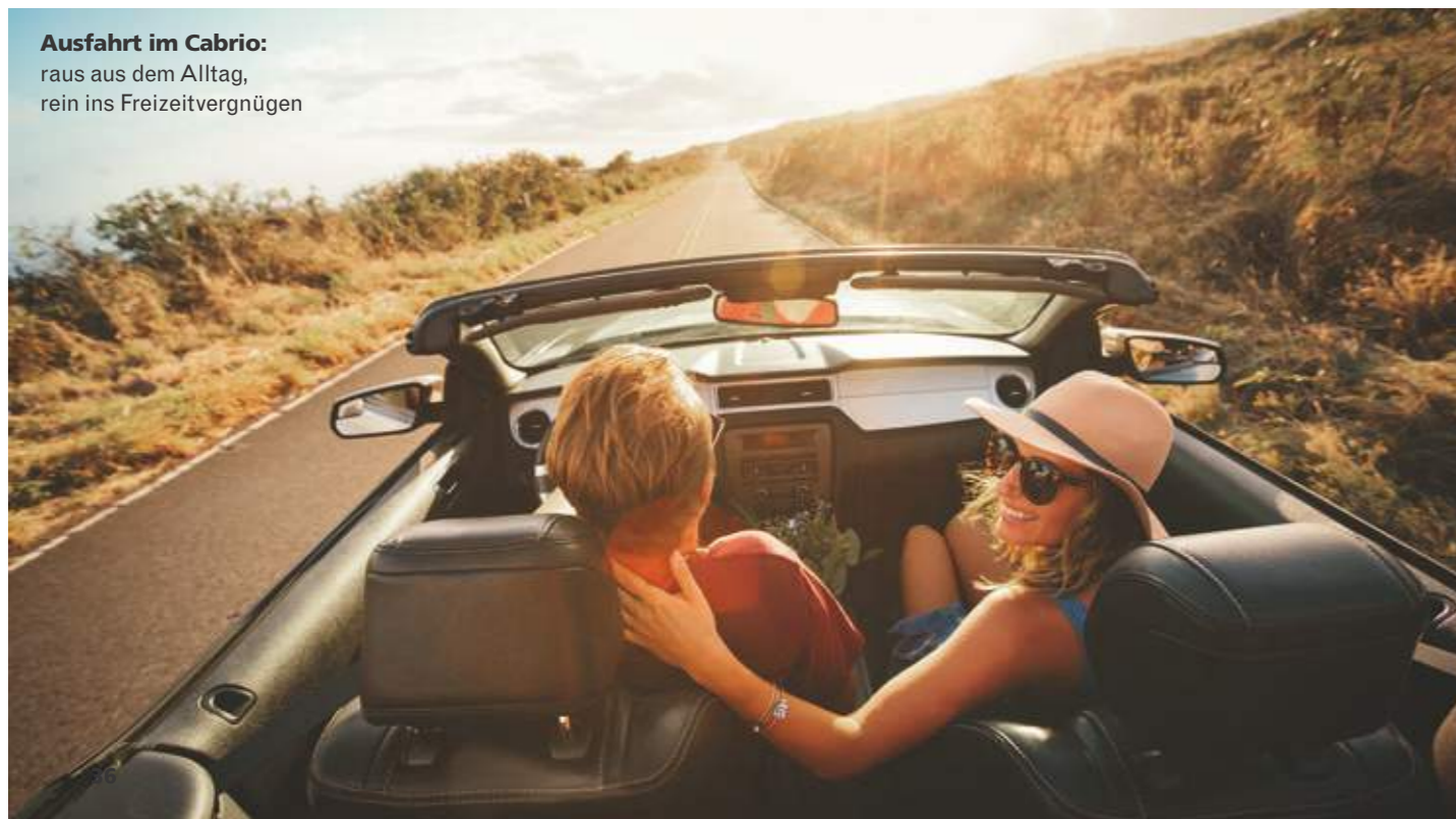
Ausfahrt im Cabrio: raus aus dem Alltag, rein ins Freizeitvergnügen