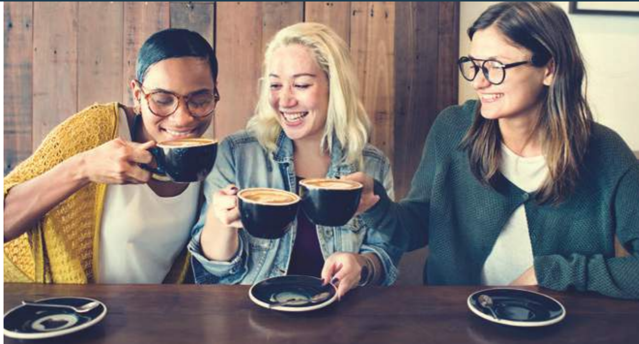
Kaffeegenuss: Unter den Kaffeeröstern hat Dallmayr die Nase vorn