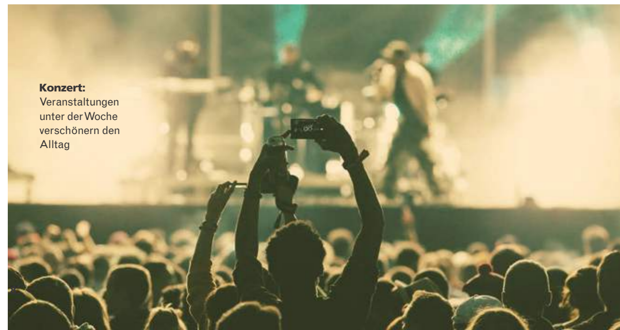
Konzert: Veranstaltungen unter der Woche verschönern den Alltag