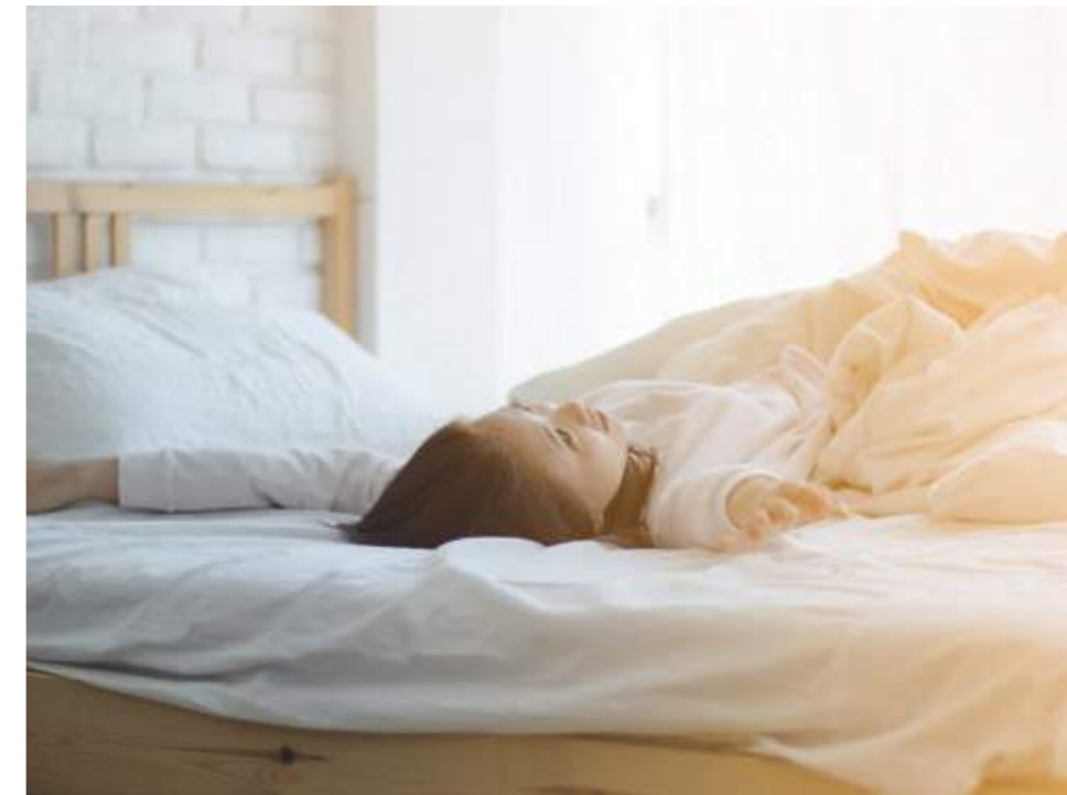
Gut gebettet: Erholung vom Pflichtprogramm