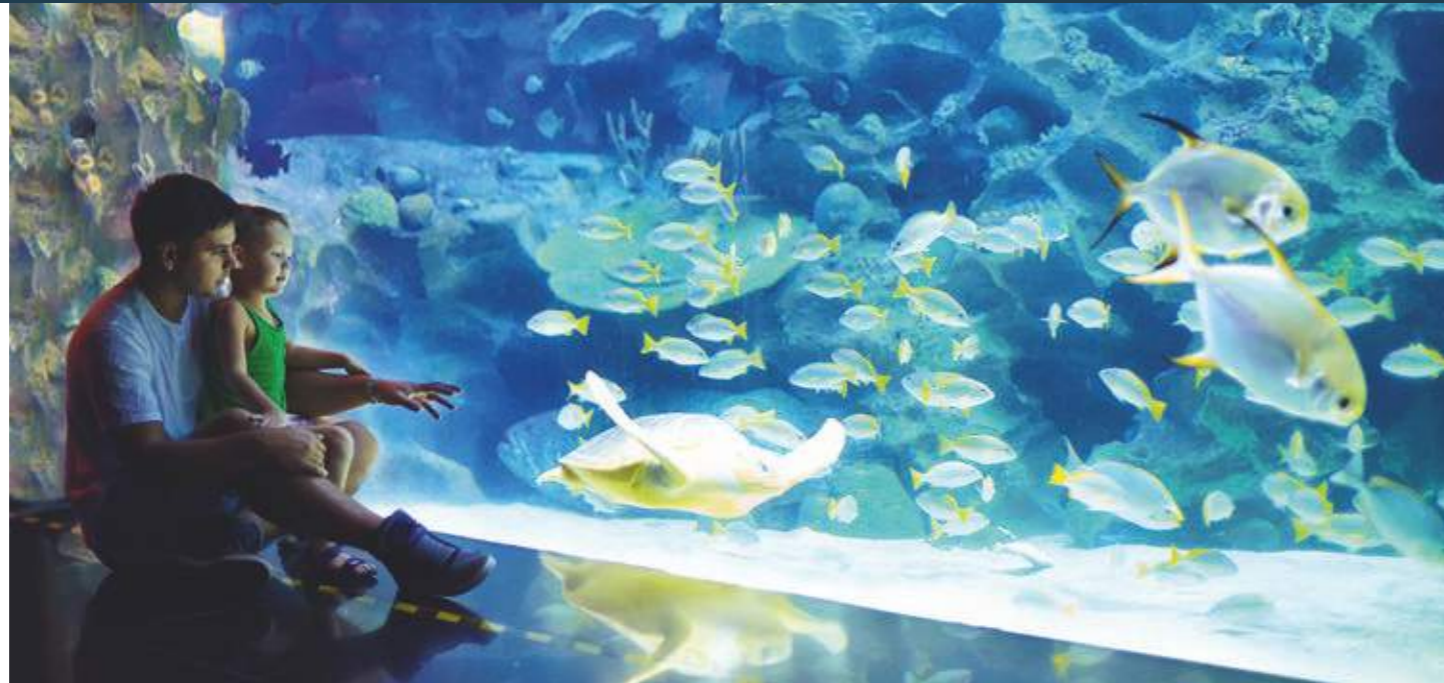
Großaquarium: Duisburg, Osnabrück und Leipzig markieren die Spitze bei den Zoos