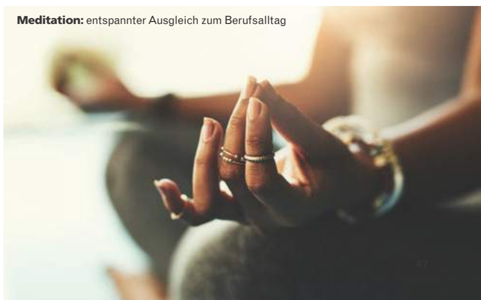
Meditation: entspannter Ausgleich zum Berufsalltag

Quelle: DEUTSCHLAND TEST. Tabelle enthält nur Unternehmen/Marken, die einen Score von mindestens 60 erreicht haben