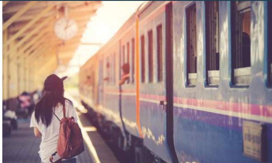
Reisende: Die Deutsche Bahn ist die Nummer eins im Schienenverkehr