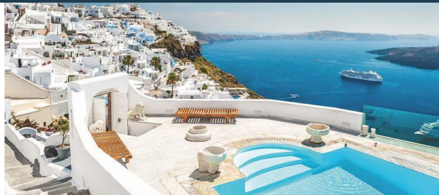
Griechenland: Traumvilla mit bestem Ausblick direkt am Meer