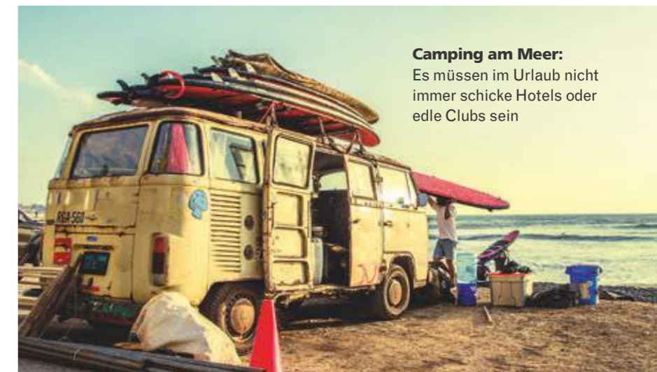
Camping am Meer: Es müssen im Urlaub nicht immer schicke Hotels oder edle Clubs sein