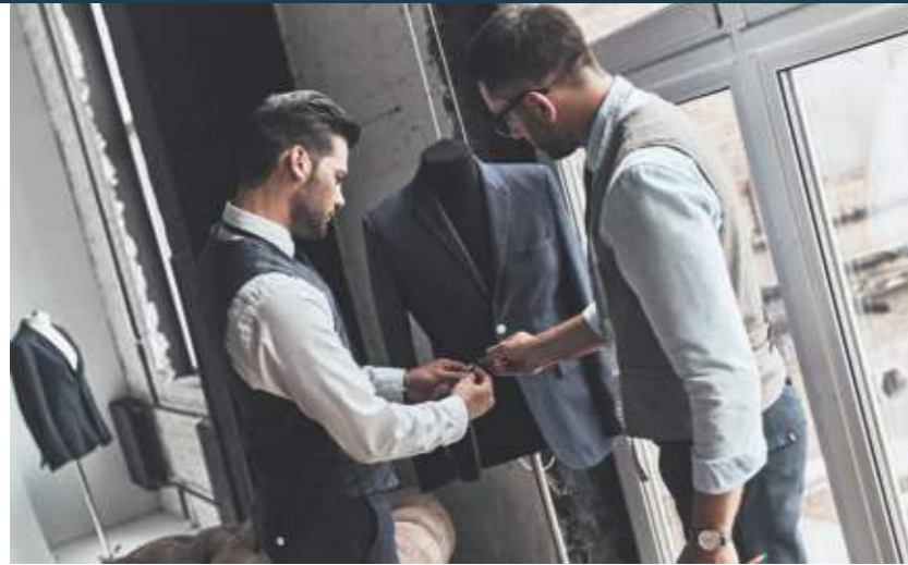
Anzug nach Maß: Leute machen Kleider