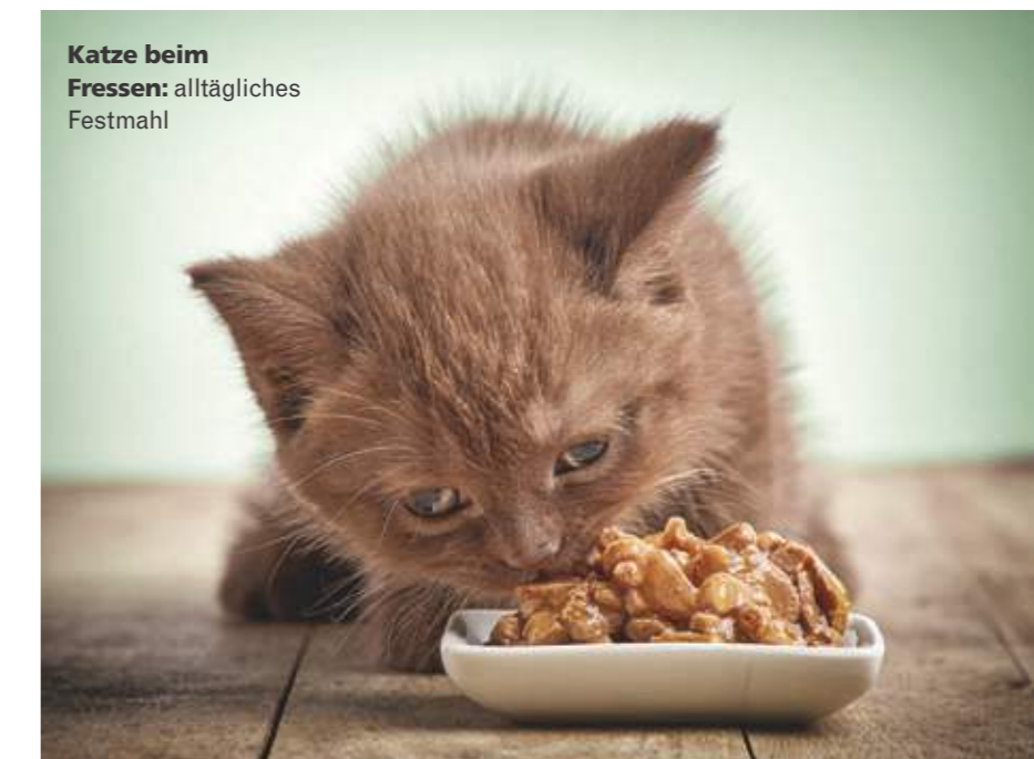
Katze beim Fressen: alltägliches Festmahl

Quelle: DEUTSCHLAND TEST. Tabelle enthält nur Unternehmen/Marken, die einen Score von mindestens 60 erreicht haben