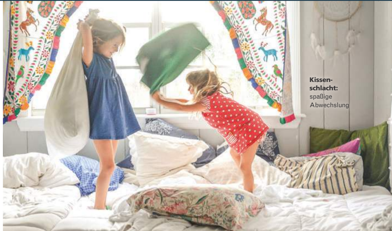
Kissen-schlacht: spaßige Abwechslung