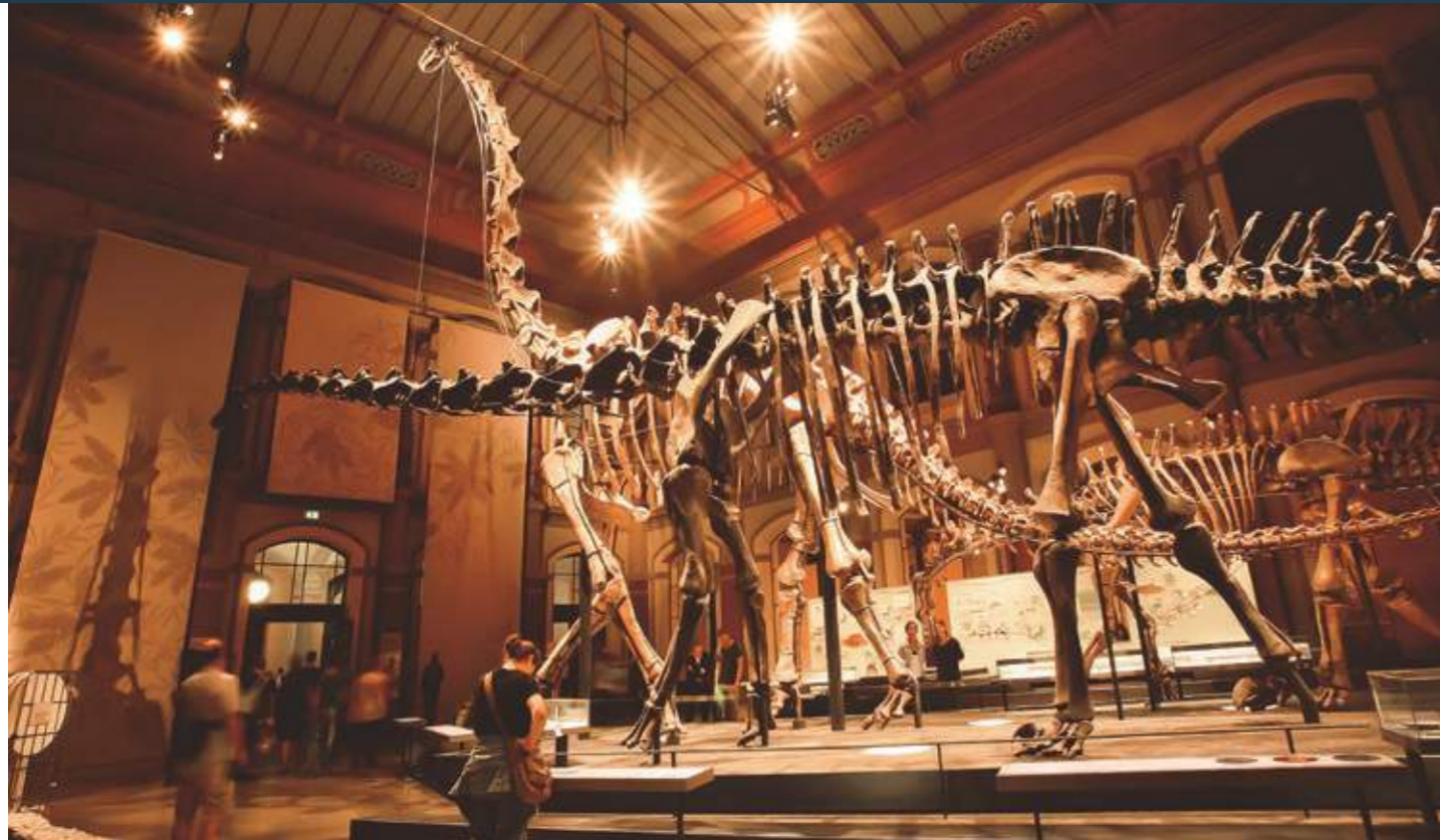
Museum: Im Bereich Kunst und Kultur spielen Museen eine wichtige Rolle