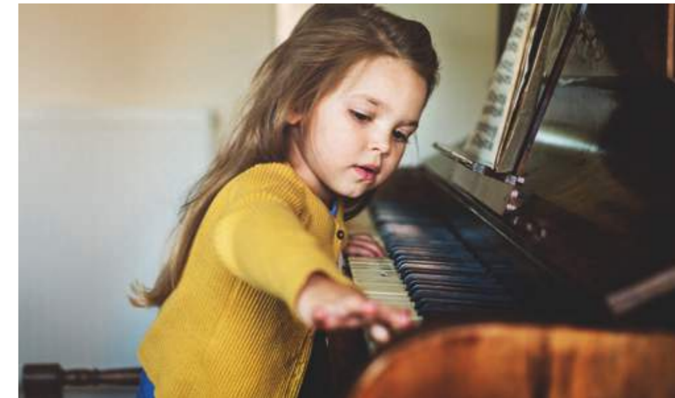
Mädchen am Klavier: Der Hersteller Yamaha schnitt bei Instrumenten am besten ab